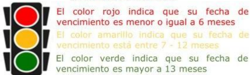
Imagen No 1. Semaforización

En el momento de dispensar un medicamento, dispositivos médicos o insumos el personal del servicio debe cerciorarse que se entregue el producto con sticker rojo primero y posteriormente el etiquetado con sticker amarillo, evitando vencimientos en el servicio farmacéutico